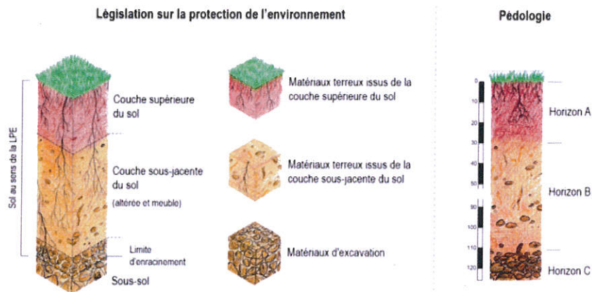
Figure 2 : Définitions du sol